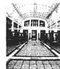
ウィーン郵便貯金局