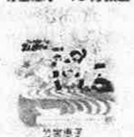
竹宮恵子のマンガ教室

芸工大図書館には、上記の漫画は所蔵していませんが、『竹宮恵子のマンガ教室』(726.1/TAK) (件名：漫画/技法)は所蔵しています。